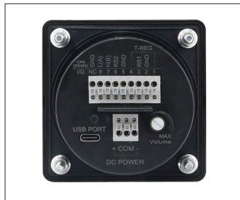
电源和RS485通讯电缆线接线端子 (背面)